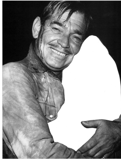
Ghosts 2013 Cut-Out, 24 x 18,5 cm