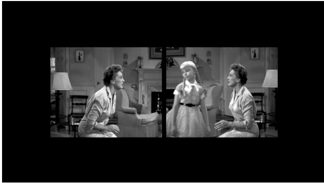
Goodbye 2013 Videostill, HD-Video, 2:38 min., 16:9, b&w/colour/stereo