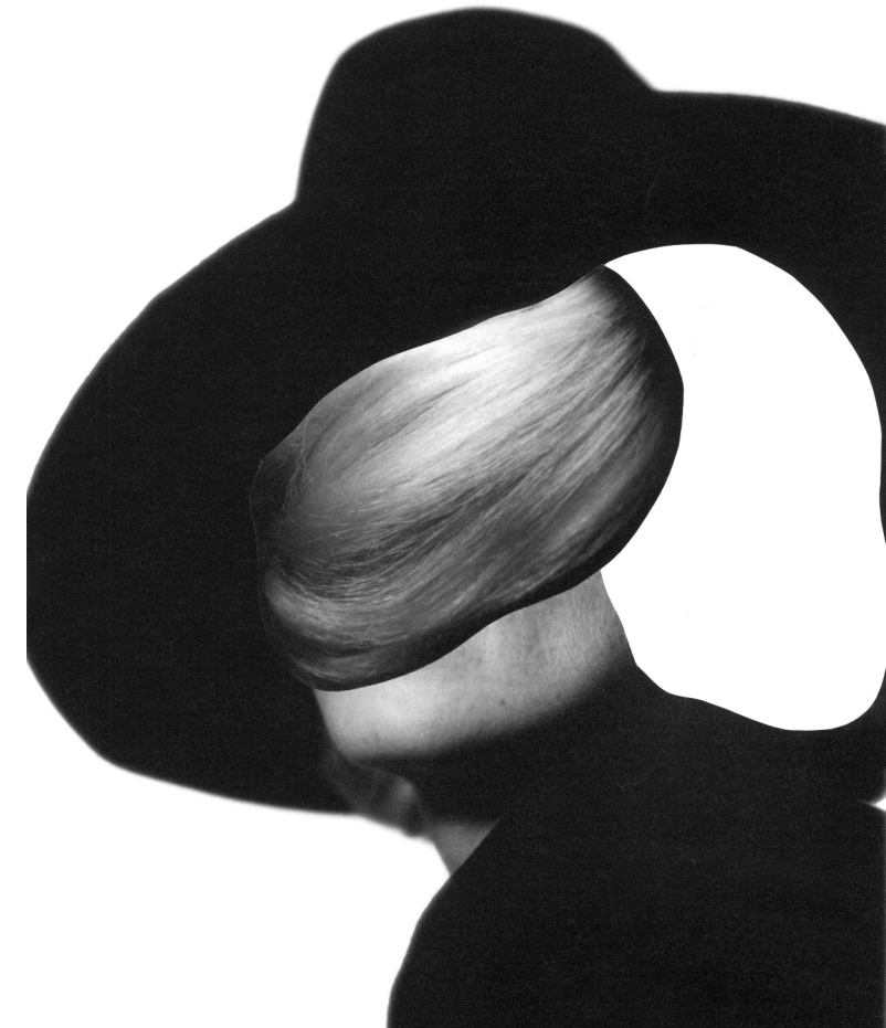
Cover Clouds 2013 Collage, 33 x 27 cm

Herausgeber für die Kulturabteilung der Stadt Wien: Berthold Ecker, Grafik: Maria-Anna Friedl